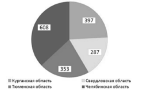
Число крестьянских (фермерских) хозяйств и индивидуальных предпринимателей, получающих субсидии (дотации) в 2020 году

В 2020 году мерами государственной поддержки воспользовались 544 крестьянских (фермерских) хозяйства и 64 индивидуальных предпринимателя, получившие субсидии (дотации) за счет средств федерального бюджета и бюджета Челябинской области, что составило 49% от общего числа фермерских хозяйств.